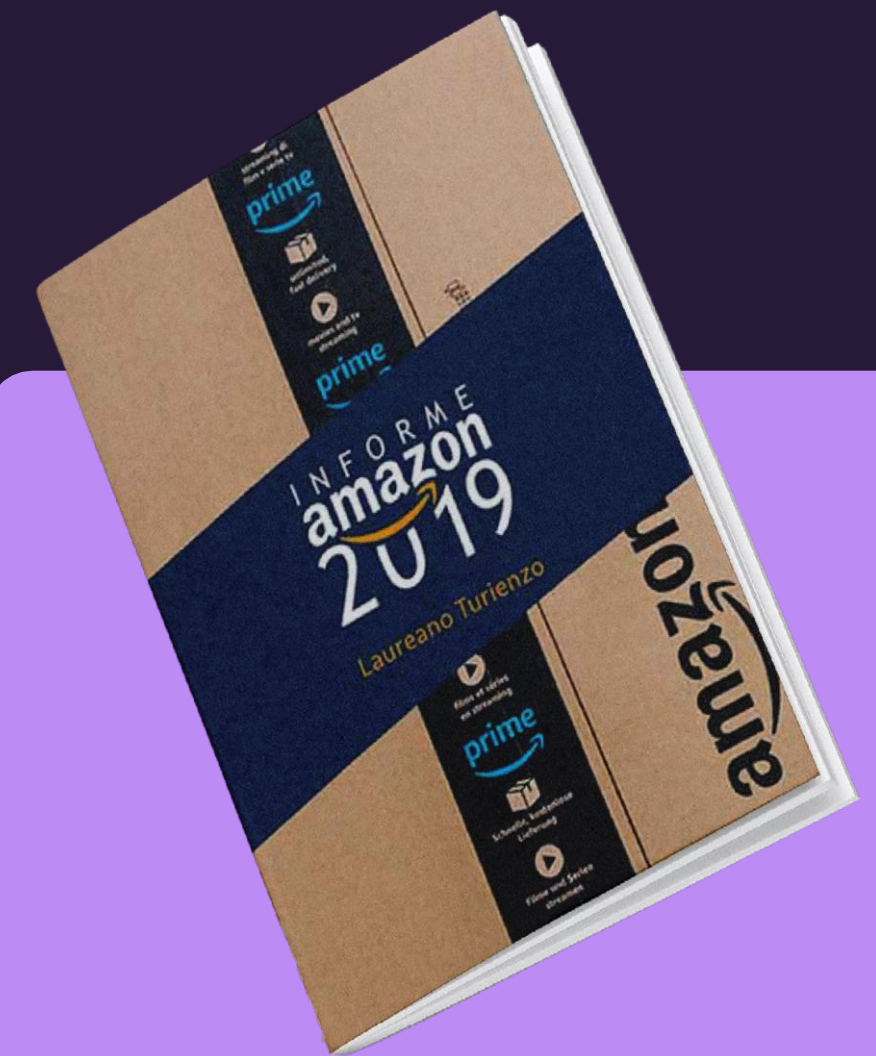
Informe Amazon 2019