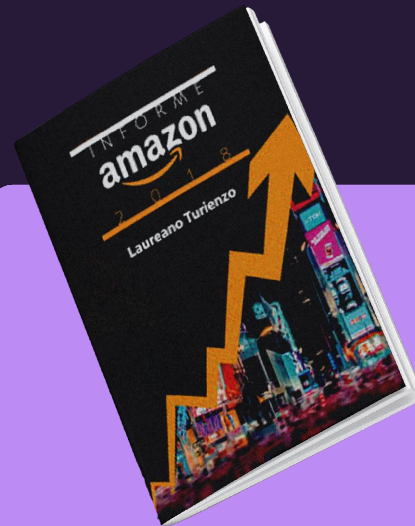
Informe Amazon 2018